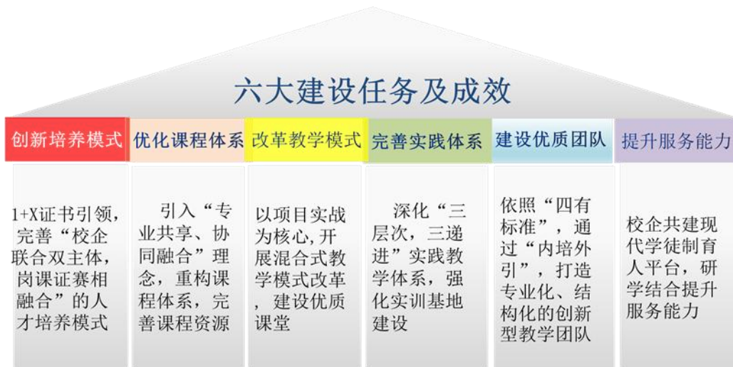
图4 数字财经商贸专业群建设规划

专业建设方面，始终坚持校企合作产教融合，秉持专业群建设理念，构建形成了以大数据与会计为核心，互联网金融与电子商务为两翼的、计算机技术为支撑的“一体两翼”数字财经商贸专业群体系。融合1+X证书内容，丰富了“校企联合双主体，岗课证赛相融合”的人才培养体系内涵，不断推进产教深度融合，深化培养模式和培养体系改革，打造双师结构团队，提升人才培育工程，办学规模和办学实力等方面已凸显明显的优势和特色。今后，数字财经商贸专业群在创新培养模式、优化课程体系、改革教学模式、完善实践体系、建设优质团队、提升服务能力等方面有如下图4所示的建设规划。