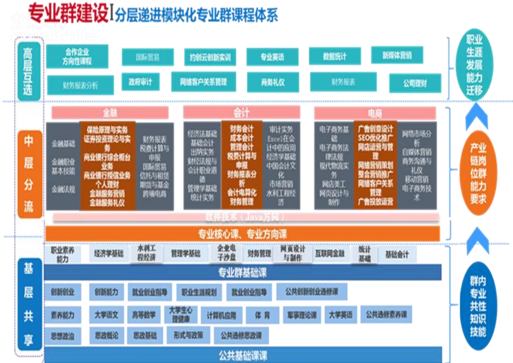
图 3 专业群课程体系模型