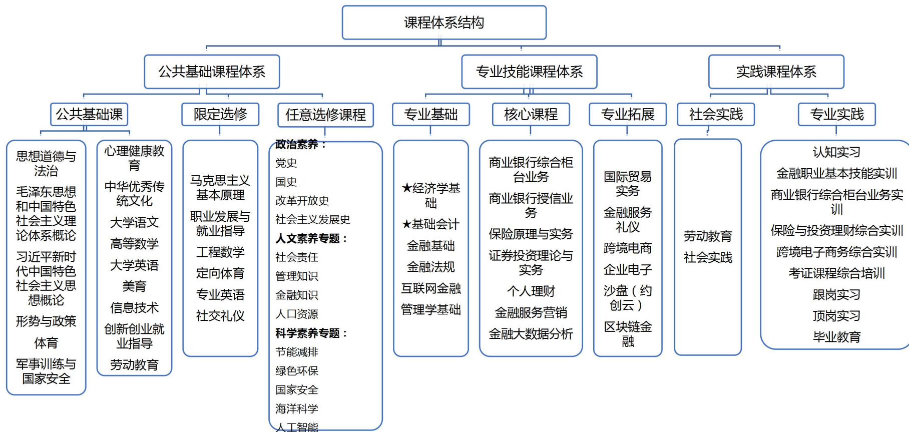
图 1 金融服务与管理专业课程架体系框图